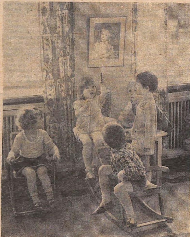
«А я так умею».